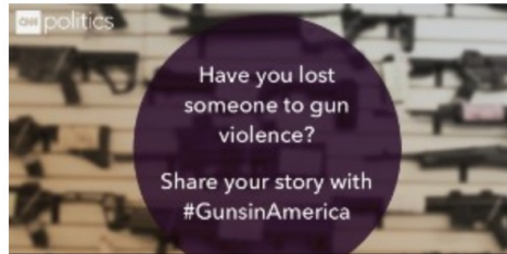
Have you lost someone to gun violence?