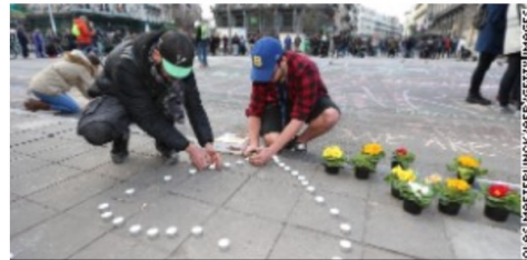
Your tributes: Brussels attacks